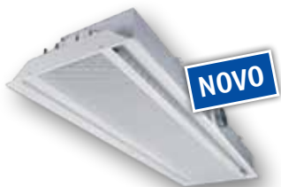
DID 642, do 450 m 3 /h svežeg vazduha