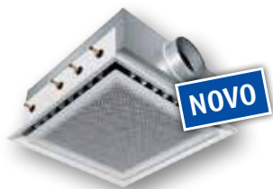
DID 614, do 300 m 3 /h svežeg vazduha